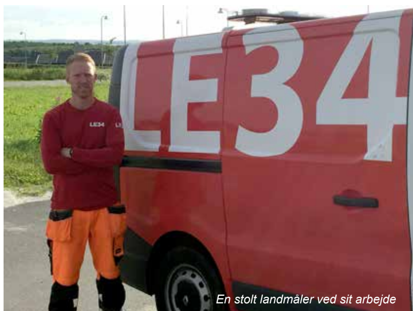
En stolt landmåler ved sit arbejde

Jeg kerer om de små detaljer, og jeg er seriøs omkring mit arbejde og kan godt lide at tænke ud af boksen. Det viser sig i kreative og til tider alternative løsninger indenfor handfaget og de mange projekter, som jeg går i gang med hjemme. Jeg tager gladeligt imod udfordringer og leverer kun opgaver, som jeg kan stå inde for. Jeg er logisk tænkende og ser ofte helheden før produktet er færdigt. Jeg er som oftest glad og nyder at tilbringe min tid med mine to piger og kone.